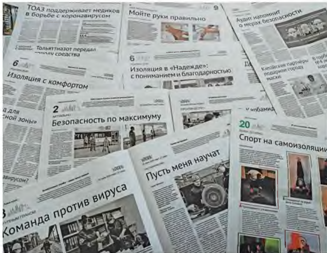
С апреля по июль газета «Волжский химик» опубликовала 67 материалов, посвящённых борьбе с коронавирусом

Главной целью было представить заводчанам полную картину о распространении коронавируса и борьбе с ним. Информационная кампания «АнтиCOVID» – не единственная, но одна из важных мер в борьбе с коронавирусной инфекцией, которые были организованы руководством нашей компании. Во многом благодаря