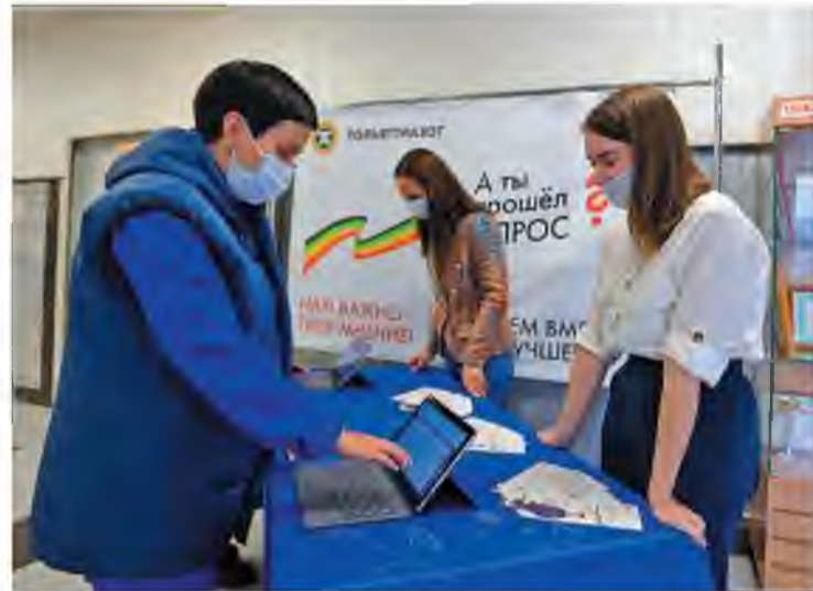
Одной из тем профсоюзного собрания стал опрос, посвящённый вовлечённости персонала

– В цехе №20 уже готовы вызывать эвакуаторы. Как только ответ из госавтоинспекции придет, стартует очистка территории от