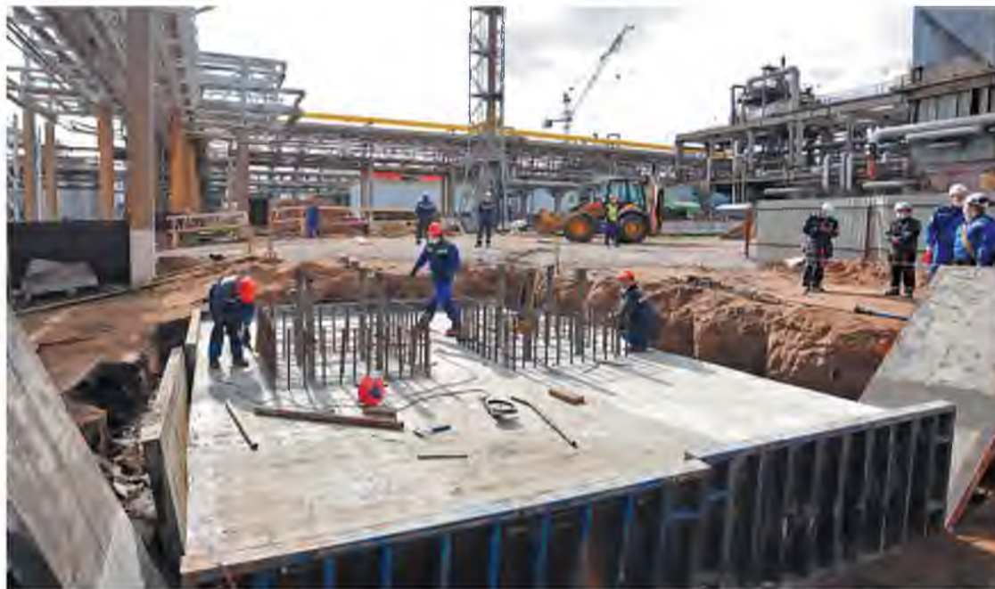
На эстакаде №3 снимают опалубку с фундаментной плиты

Он рассказывает: на стройке постоянно улучшается отно-