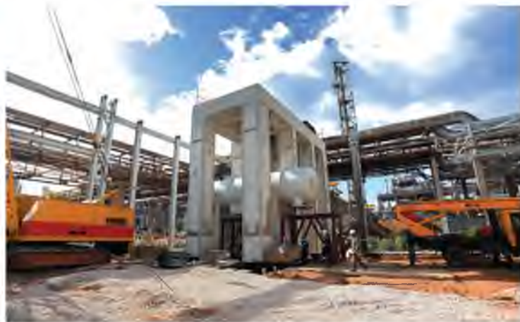
Монтаж оборудования и металлоконструкций продолжается на объекте №501/3 – будущей установке компрессии №3