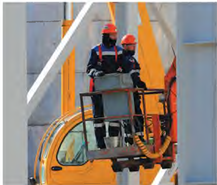
На объекте №542, который после завершения строительства будет называться градирней, монтируют металлоконструкции